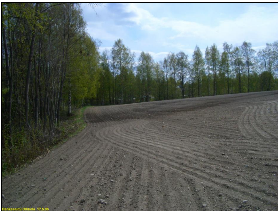
Kärjen itärantaa kärkialueen asuinpaikan osan pohjoisimman kvartsilöydön tasalta etelään.