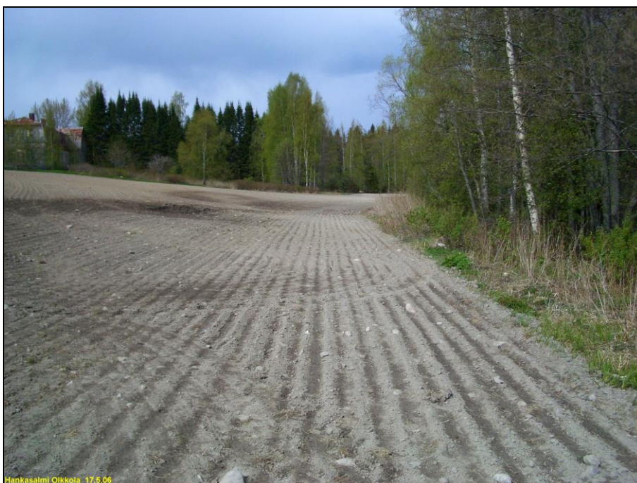
Itärannan pohjoisosan erillinen löytöpaikka kuvan etualalla, kuvattu pohjoiseen. Takana vasemmalla, rintein laella Olkkolan päärakennus.