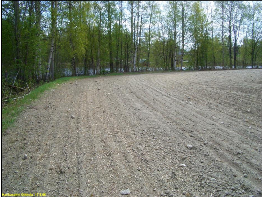
Niemen kärkinipukan itärantaa. Kivikautisia asuinpaikkalöytöjä koko kuvan alalta. Alla: Niemen kärki kuvattuna kauempaa etelään.